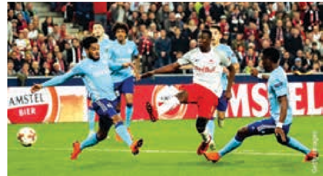
Amadou Haidara otevřel zápasové skóre proti Marseille v semifinále Evropské ligy v r. 2018. FC Salzburg se téměř dostal do finále.

Nemyslím si, že je mezi tím velký rozdíl. Co do obsahu je to stejné. Vždycky se adaptujete na svůj tým, a co se týká trénování, je to také velmi podobné. Je to rovněž z toho důvodu, že v Salzburgu máme nastavený stejný koncept od mládežnického týmu až po A tým. A navíc, když pracujete se zkušenými profesionály, jste schopni komunikovat přímým a efektivním způsobem.