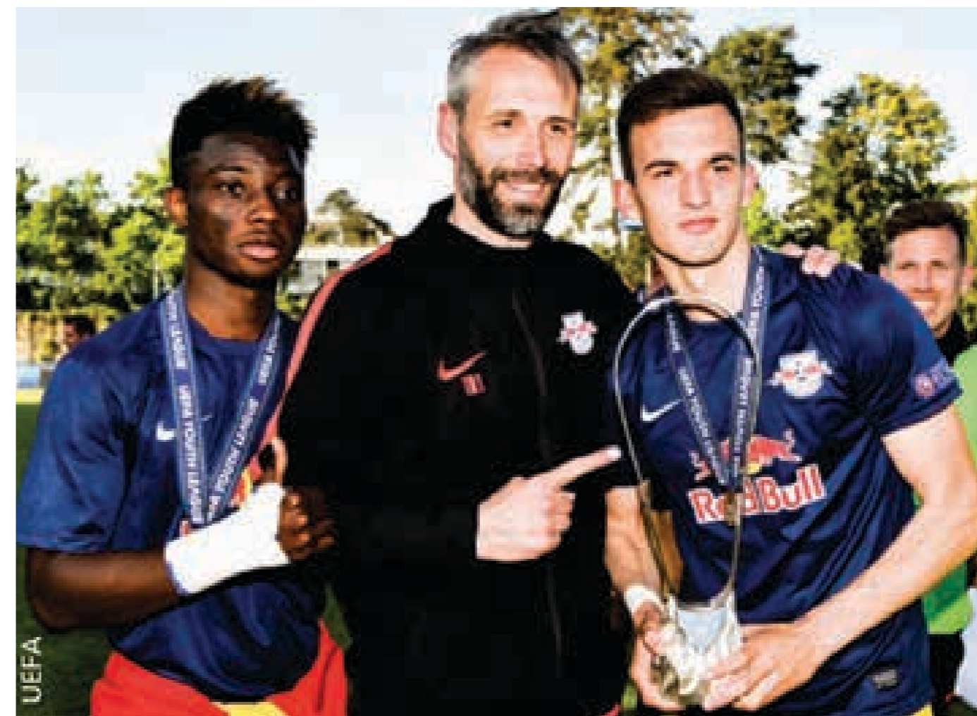
Vítězství v Youth League v r. 2017 umožnilo mládežnické akademii v Salzburgu zdokonalit svoje dovednosti. A Marco Rose se stal trenérem A týmu.